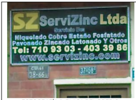
FOTOGRAFÍA 2. PLACA DEL PREDIO