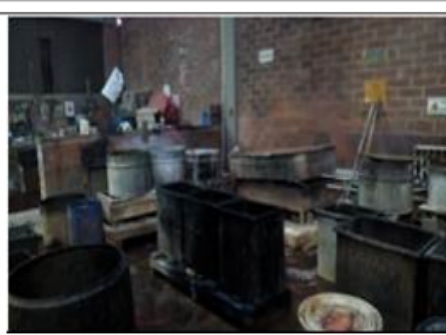
FOTOGRAFÍA 4. AREA DE DESENGRASE