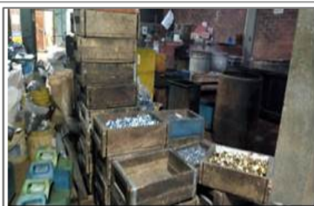
FOTOGRAFÍA 7. PRODUCTO TERMINADO