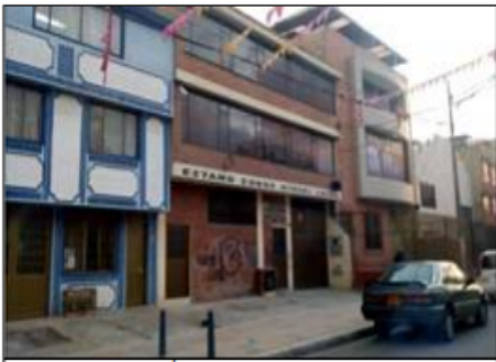
FOTOGRAFÍA 1. FACHADA DEL PREDIO