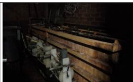
FOTOGRAFÍA 6. BAÑOS ELECTROLITICOS PARA NIQUELADO