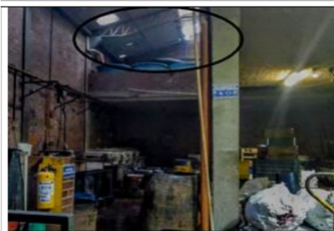
FOTOGRAFÍA 3. AREA PARCIALMENTE CONFINADA