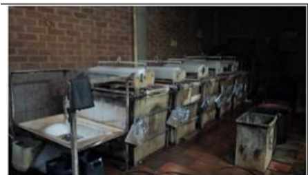
FOTOGRAFÍA 5. BAÑOS ELECTROLITICOS PARA ZINC